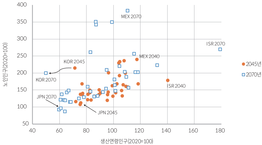
[그림 3] OECD 국가의 생산연령인구-노인인구 전망: 2045년, 2070년

주: 2020년의 생산연령인구와 노인인구를 100으로 하여 2045년과 2070년의 인구를 지수화함