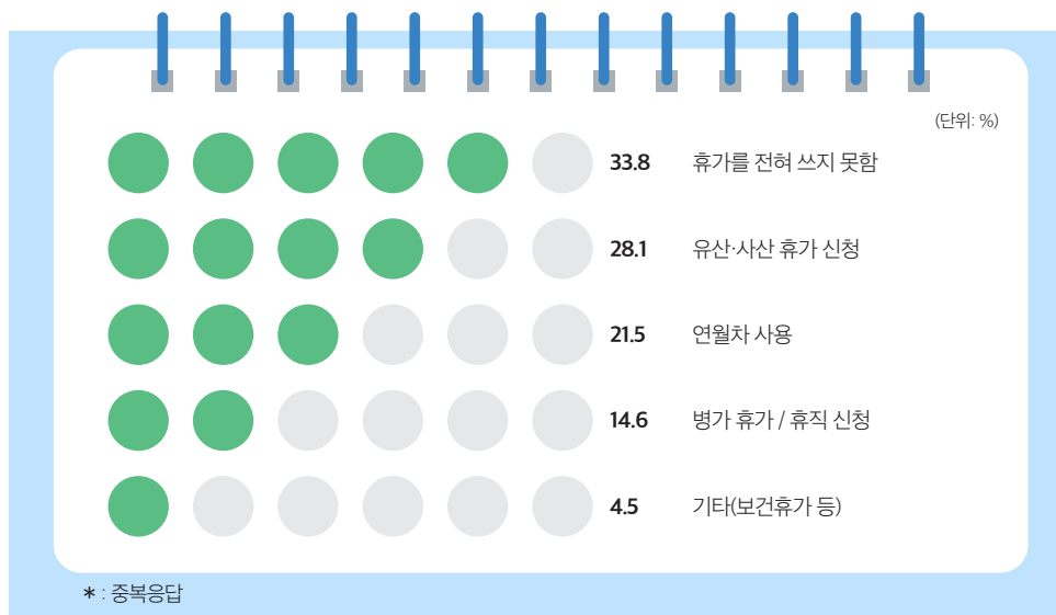
<그림 2> 유산·사산 당시 신청한 휴가 종류*